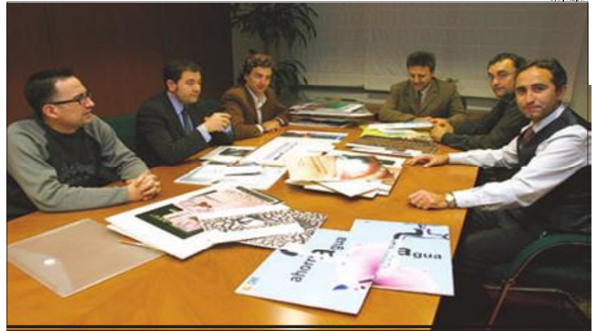
El jurado reunió el pasado lunes en INFORMACION que valoró los trabajos del concurso dirigido a los estudiantes

Tras la realización de esta mesa redonda se procederá a la proyección de los spots galardonados en el Festival de Cannes 2003. Al fi-